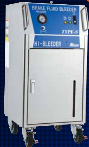
BB-1000RNS / BB-910RNS / BB-920RNS