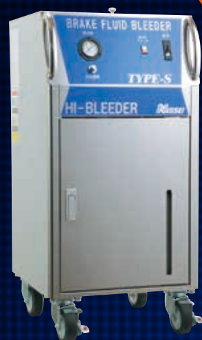
BB-1000RNS / BB-910RNS / BB-920RNS